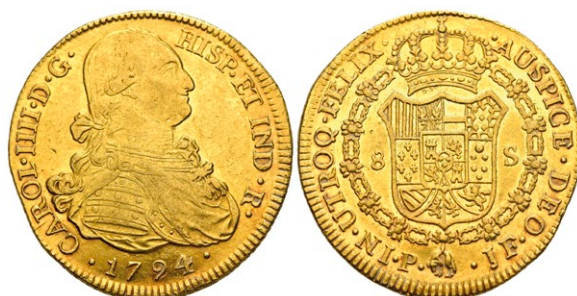
1346 CARLOS IV (1788-1808). 8 Escudos. (Au. 27,03g/37mm). 1794. Popayán JF. (Cal-2019-1665). EBC-. Restos de brillo original. 1300 €