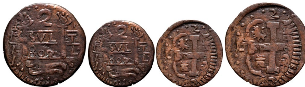
1380 FERNANDO VII (1808-1833). 2 Reales (Ae.3,85g/28mm). Fecha fantástica: 800. (C.a. 1815). Cartagena (Colombia). Ni Aureo ni Km citan. (Restrepo-118.1). MBC+. Rarísima. 700 €