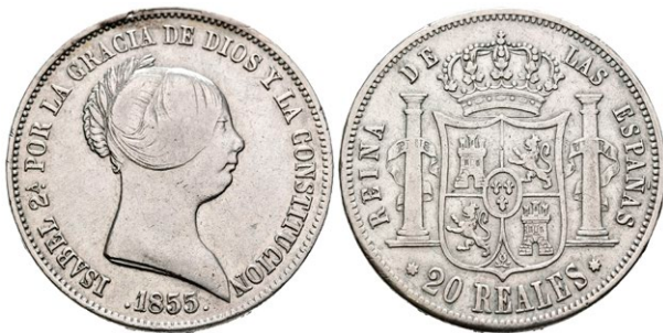
1501 ISABEL II (1833-1868). 20 Reales. (Ar. 25,62g/37mm). 1855. Sevilla. (Cal-2019-632). MBC+. 70 €