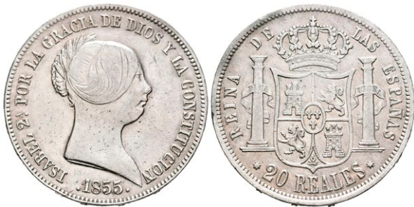
1500 ISABEL II (1833-1868). 20 Reales. (Ar. 25,86g/37mm). 1855. Sevilla. (Cal-2019-632). MBC+. 70 €