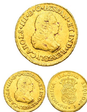
1281 CARLOS III (1759-1788). 1 Escudo. (Au. 3,33g/19mm). 1762. Popayán J. (Cal-2019-1411). Busto de Fernando VI. MBC-. 250 €