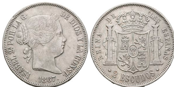
1497 ISABEL II (1833-1868). 2 Escudos. (Ar. 25,73g/37mm). 1867. Madrid. (Cal-2019-647). MBC+/EBC-. Restos de brillo original. 125 €