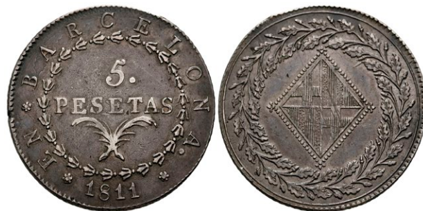
1357 CATALUÑA NAPOLEONICA (1808-1814). 5 Pesetas. (Ar. 26,93g/39mm). 1811. Barcelona. (Cal-2019-47). 25 Rosetas. MBC/MBC+. Pátina oscura. 200 €