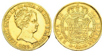
1509 ISABEL II (1833-1868). 80 Reales (Au. 6,73g /21mm). 1839. Barcelona PS. (Cal-2019-704). EBC-. Muesca en listel. Leves marquitas. 275 €