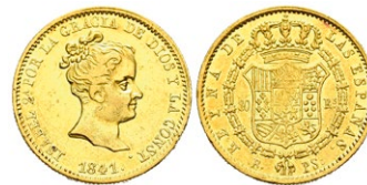
1510 ISABEL II (1833-1868). 80 Reales (Au. 6,72g /21mm). 1841. Barcelona PS. (Cal-2019-707). MBC+. 275 €