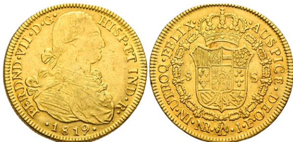
1423 FERNANDO VII (1808-1833). 8 Escudos (Au. 27,01g/38mm). 1819. Santa Fe de Nuevo Reino JF. (Cal-2019-1857). MBC+. 1400 €