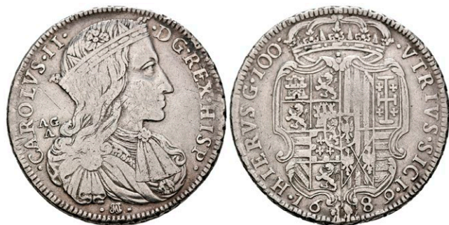
1202 CARLOS II (1665-1700). 100 Grana (Ar. 25,08g/41mm). 1689. Nápoles AG/A. (Vicenti-192). MBC. Escasa. 150 €