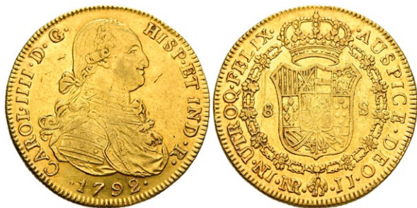
1345 CARLOS IV (1788-1808). 8 Escudos. (Au. 26,93g/38mm). 1792. Santa Fe de Nuevo Reino JJ. (Cal-2019-1721). MBC+. 1200 €