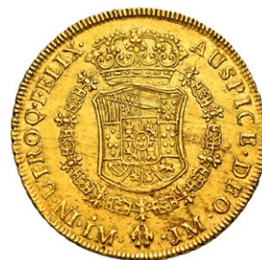
1286 CARLOS III (1759-1788). 8 Escudos. (Au. 26,97g/37mm). 1771. Lima JM. Segundo tipo de cara de rata. (Cal-2019-1926). MBC+. Precioso tono. Ligeras rayitas en reverso. 2500 €

México, Lima, Santa Fe de Nuevo Reino, Santiago de Chile, Guatemala, Madrid y Sevilla, acuñan entre 1672 y 1772 el famoso Cara de Rata, uno de los retratos más icónicos del grabador y medallista Tomás Francisco Prieto y de toda la numismática española y que aparecen entre los módulos comprendidos entre el ½ y los 8 Escudos. La ceca de Lima fue, junto a la de México, la más prolífica en cuanto a piezas acuñadas se refiere, encontrando además en ésta dos subtipos de bustos diferenciados básicamente por la forma de la nariz. El primer tipo iría entre 1763 y 1768 y el segundo entre ese mismo 1768 y 1772, fecha en la que se unifican los bustos en el llamado busto propio.