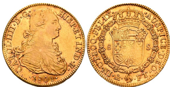
1344 CARLOS IV (1788-1808). 8 Escudos. (Au. 27,00g/37mm). 1801 México FT. (Cal-2019-1644). EBC. Restos de brillo original. Preciosa pátina naranja. 1400 €