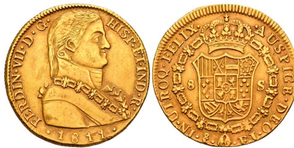
1424 FERNANDO VII (1808-1833). 8 Escudos (Au. 27,02g/37mm). 1811. Santiago FJ. Busto almirante. (Cal-2019-1865). EBC. Preciosa pátina. 2500 €