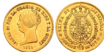
1513 ISABEL II (1833-1868). Doblón de 100 Reales. (Au. 8,18g/22mm). 1851. Madrid CL. (Cal-2019-758). MBC+. Escaso ejemplar. 450 €