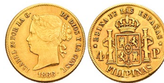
1522 ISABEL II (1833-1868). 4 Pesos. (Au. 6,70g/21mm). 1866/59. Manila. (Cal-2019-860). MBC+. Escaso ejemplar y más con esta sobrefecha. Limpiado. 500 €