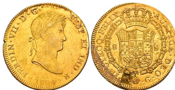
1420 FERNANDO VII (1808-1833). 8 Escudos. (Au. 27,00g/37mm). 1824. Cuzco G. (Cal-2019-1745). EBC. Espectacular ejemplar con precioso brillo original. Hasta el momento se trata de la mejor pieza que conocemos acuñada en esta ceca a pesar de la hoja sin saltar del reverso. Muy rara así. 3000 €