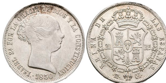
1488 ISABEL II (1833-1868). 20 Reales. (Ar. 26,08g/37mm). 1850. Madrid CL. (Cal-2019-59). EBC-/EBC. 125 €