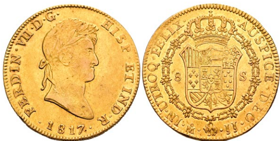
1421 FERNANDO VII (1808-1833). 8 Escudos. (Au. 27,00g/37mm). 1817. México JJ. (Cal-2019-1795). EBC/EBC+. Precioso ejemplar, manteniendo restos de brillo original. Escaso así. 1500 €