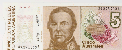
Argentina, 5 australes

El nuevo peso argentino fue creado en 1970 y sustituido por el peso argentino (1983) y el austral (1985), para volver al peso en 1992. El billete de 50 australes representa al estadista y escritor Bartolomé Mitre, presidente de Argentina entre 1862 y 1868.