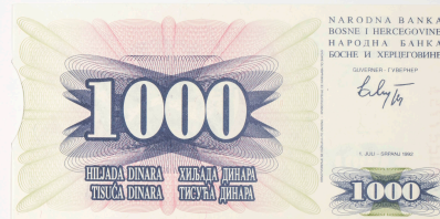
Bosnia, 1.000 dinars