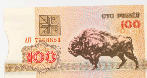
Bielorrusia, 100 rublos