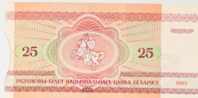
Bielorrusia, 25 rublos

El bisonte europeo que aparece en este billete es uno de los tesoros faunísticos de Bielorrusia, ya que en la frontera con Polonia habitan los últimos ejemplares de esta especie.