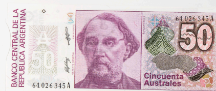
Argentina, 50 australes