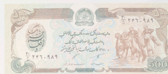
Afganistán, 500 afghanis

El Banco de Afganistán introdujo el afgani como moneda oficial del país en 1926 y en 1935 emitió su primer billete. Tras la caída del régimen talibán en 2002, se sustituyó por el nuevo afgani.