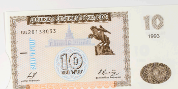
Armenia, 10 dram

Bosnia (zona croata musulmana) empezó a acuñar dinero durante la guerra civil, los cuales estuvieron en uso hasta 1998. En este billete se muestra el puente de Mostar, que divide el barrio croata del musulmán.