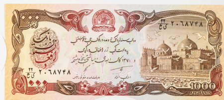
Afganistán, 1.000 afghanis

Este billete muestra la famosa mezquita de Mazar-i-Sharif, en el norte del país, cubierta totalmente por palomas. En el reverso aparecen unos arcos, recuerdo de un pasado en el que Afganistán estuvo bajo la mano de Alejandro Magno.