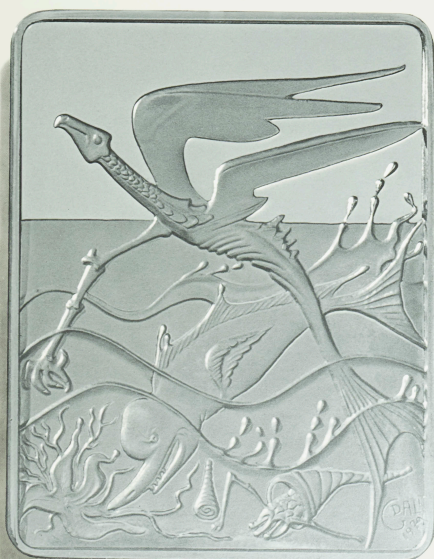
EL 5.º DÍA DE LA CREACION POR SALVADOR DALÍ Dijo Dios: Bullan las aguas de animales vivientes, y aves revoloteen sobre la tierra contra el firmamento celeste. Y creo Dios los grandes monstruos marinos y todo animal viviente.