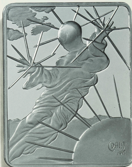
EL 4.º DÍA DE LA CREACION POR SALVADOR DALÍ Dijo Dios: Haya luceros en el firmamento celeste, para apartar el día de la noche y valgan de señales para solemnidades, días y años.