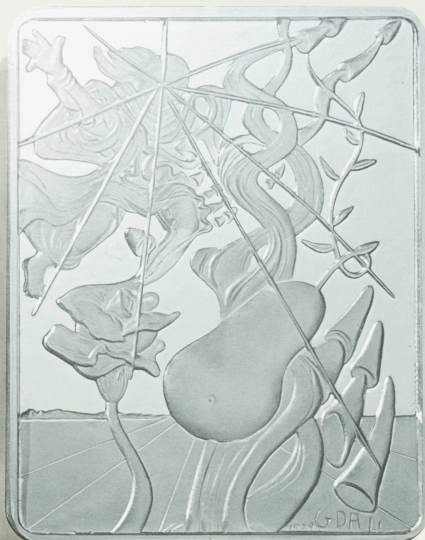
EL 3.º DÍA DE LA CREACION POR SALVADOR DALÍ Dijo Dios: Produzca la tierra vegetación: hierbas que den semillas, y árboles frutales que den fruto, de su especie, con su semilla dentro, sobre la tierra.