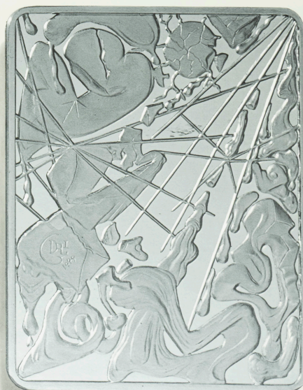
EL 1.º DÍA DE LA CREACION POR SALVADOR DALÍ La tierra era caos y confusión, oscuridad por encima del abismo. Dijo Dios: "Haya luz" y hubo luz.