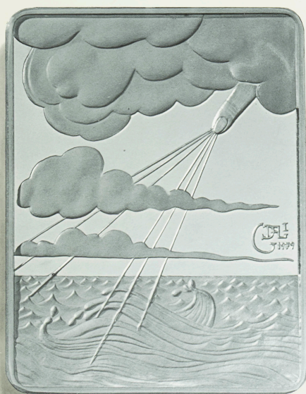
EL 2.º DÍA DE LA CREACION POR SALVADOR DALÍ Dijo Dios: Haya un firmamento por medio de las aguas, que las aparte unas de otras. Y llamó Dios al firmamento "cielos"